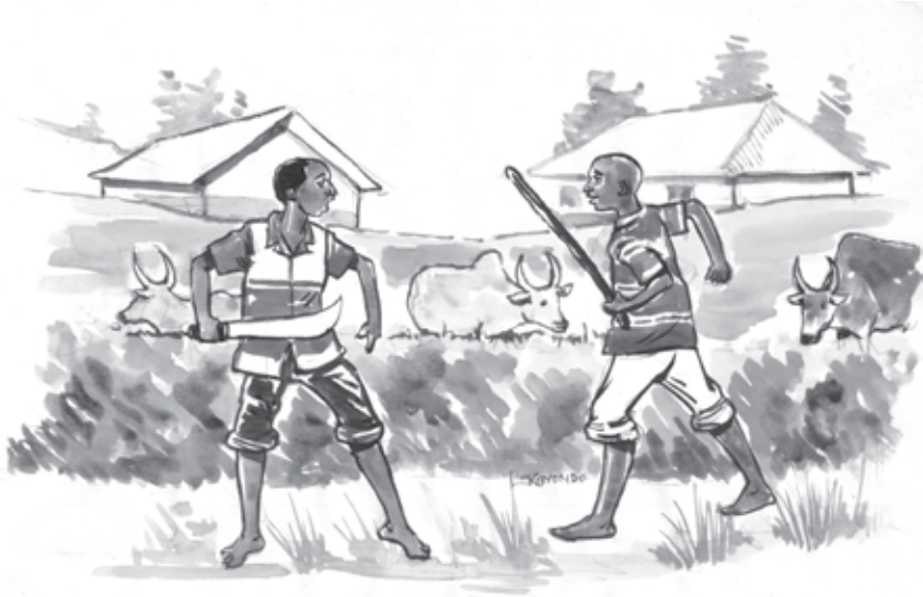
Amamukau a ngalup